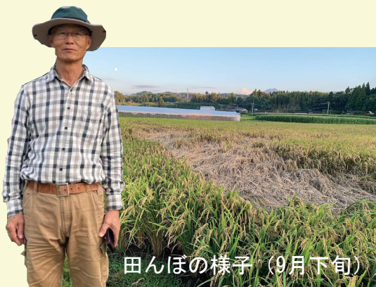
田んぼの様子 (9月下旬)