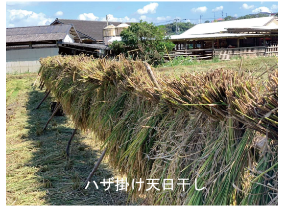
ハザ掛け天日干し