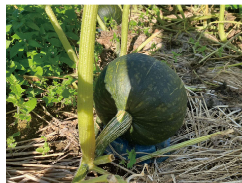
底上げしたかぼちゃ

A.Q. かぼちゃの収穫タイミングは? A. 花が咲いてから55日後くらい。または、ヘタが「ルク」状になって、茶色く乾燥したらいい頃合いです。